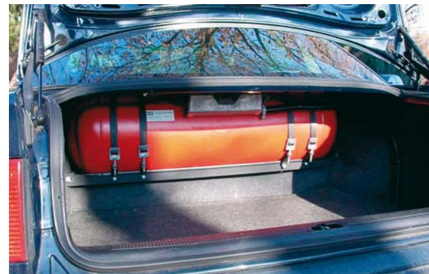
Gastank im Kofferraum