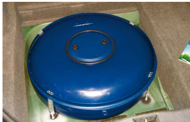
Gastank in Reserveradmulde

Fast jedes Fahrzeug mit Ottomotor kann für etwa 1500-3500 Euro umgebaut werden. Das Leergewicht einer Flüssiggas-Anlage beträgt etwa 40 kg. Der Tank findet seinen Platz entweder in der Reserveradmulde (das Reserverad wird dann durch ein Pannenspray ersetzt) oder im Kofferraum. Auch Unterflurtanks sind möglich. Die Reichweite beträgt je nach Verbrauch 350-1000 km.