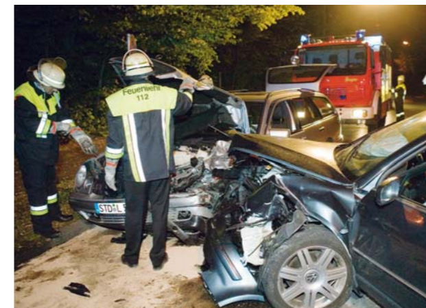
Bei einem Frontalzusammenstoß besteht bei Gasfahrzeugen kein erhöhtes Sicherheitsrisiko.

in denen Erdgas mit einem Druck von 200 bar gespeichert wird, sind aus Spezialstahl und für eine Druckbelastung von 600 bar (Berstdruck) ausgelegt. Jeder Behälter wird vor dem Einbau individuell geprüft. Zum zusätzlichen Schutz und im Falle einer Kollision sind die Tanks in einer stabilen Stahlrohrkonstruktion montiert.